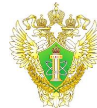
Федеральная служба по экологическому, технологическому и атомному надзору