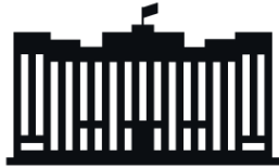
Государственная Дума Федерального Собрания Российской Федерации