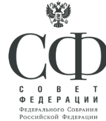
Совет Федерации Федерального Собрания Российской Федерации